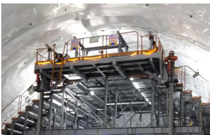
昇降台全景 (台車の外側から見る)